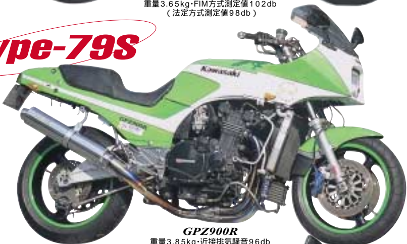
GPZ900R 重量3.85kg・近接排気騒音96db