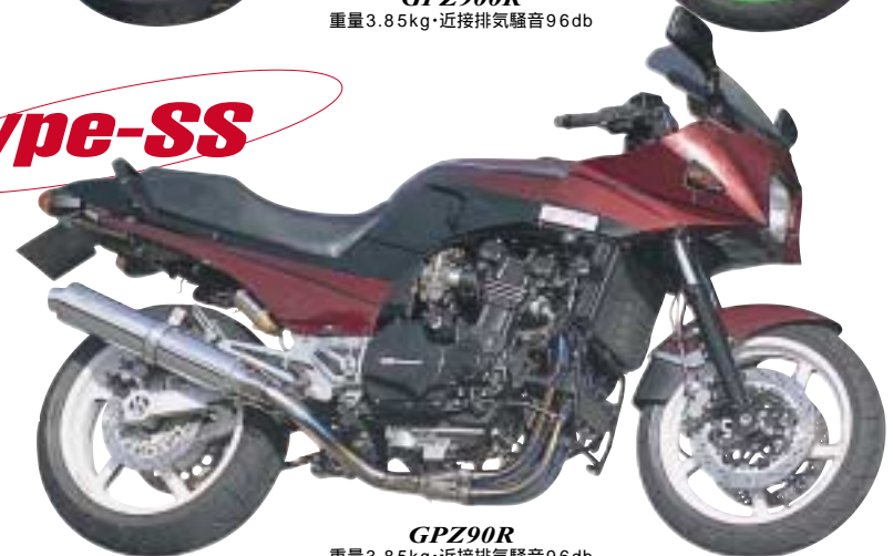
GPZ900R 重量3.85kg・近接排気騒音96db