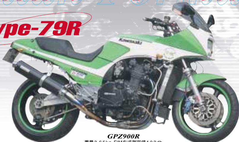
GPZ900R 重量3.65kg・FIM方式測定値102db (法定方式測定値98db)