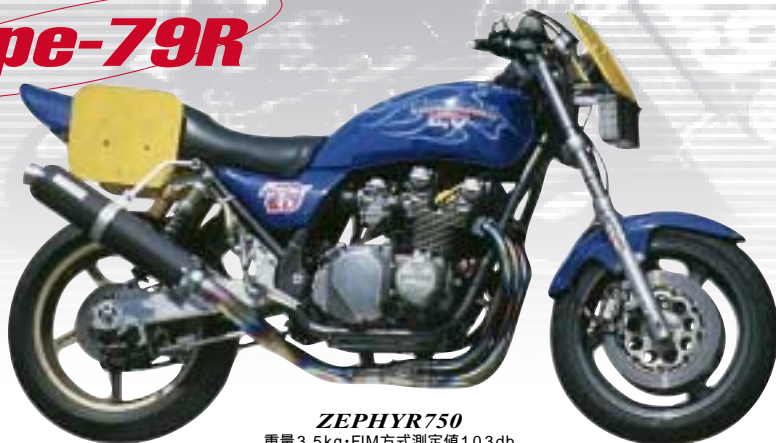
ZEPHYR750 重量 3.5kg・FIM方式測定値 103db (法定方式測定値 96db)