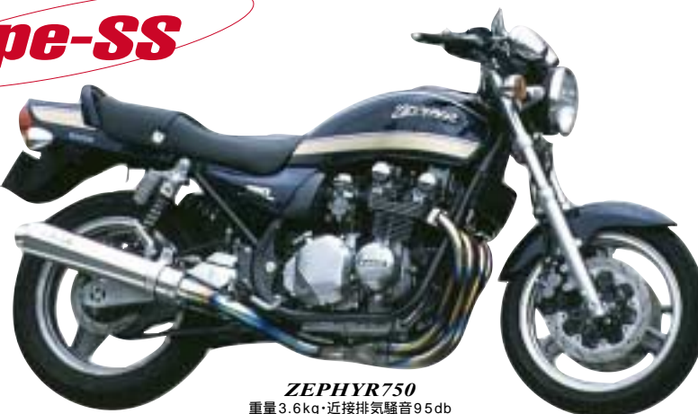
ZEPHYR750 重量 3.6kg・近接排気騒音 95db