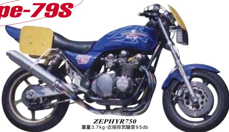
ZEPHYR750 重量 3.7kg・近接排気騒音 95db