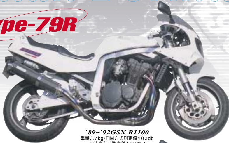
'89~'92GSX-R1100 重量3.7kg・FIM方式測定値102db (法定方式測定値100db)