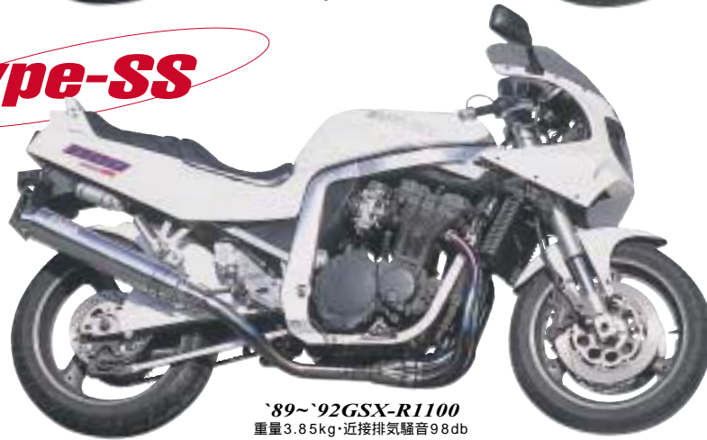
'89~'92GSX-R1100 重量3.85kg・近接排気騒音98db