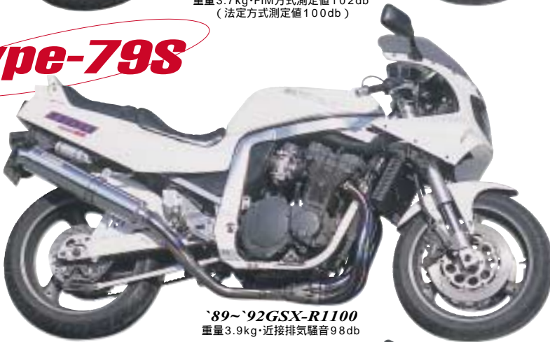
'89~'92GSX-R1100 重量3.9kg・近接排気騒音98db