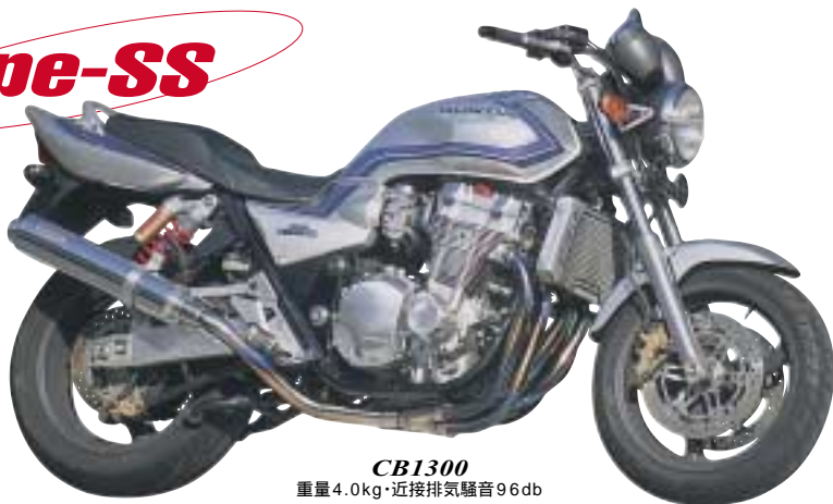
CB1300 重量4.0kg・近接排気騒音96db