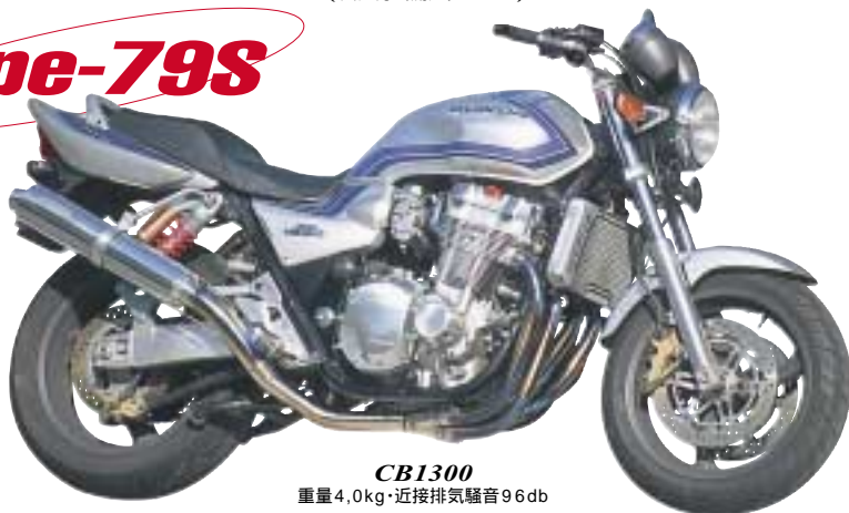
CB1300 重量4.0kg・近接排気騒音96db