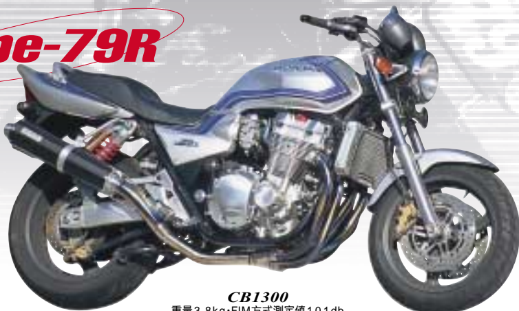
CB1300 重量3.8kg・FIM方式測定値101db (法定方式測定値97db)