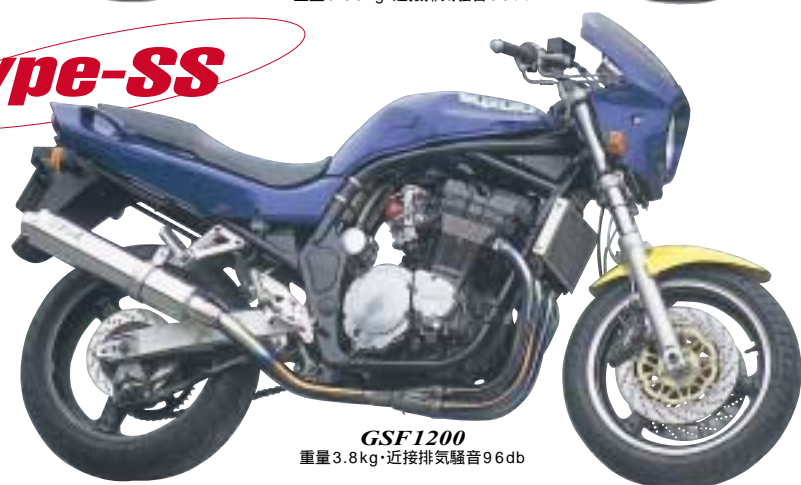
GSF1200 重量3.8kg・近接排気騒音96db