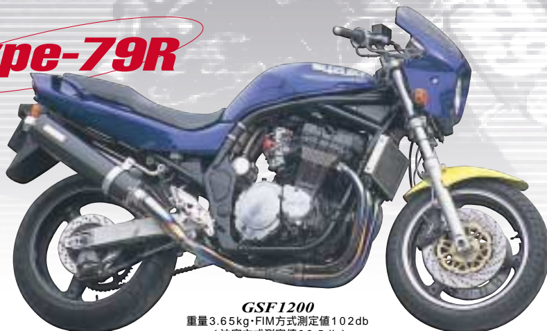
GSF1200 重量3.65kg・FIM方式測定値102db (法定方式測定値98.5db)