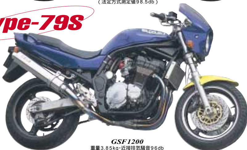
GSF1200 重量3.85kg・近接排気騒音96db