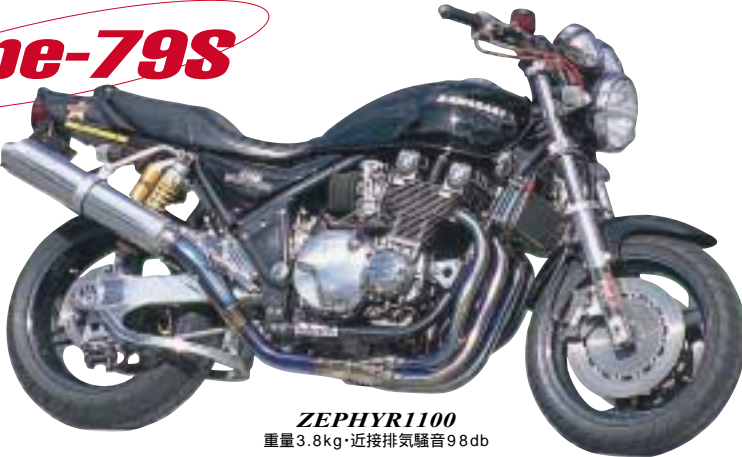
ZEPHYR1100 重量 3.8kg・近接排気騒音 98db