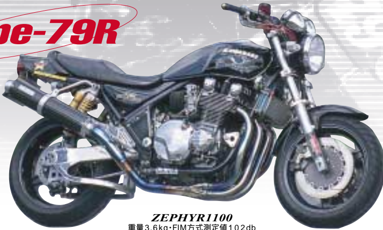
ZEPHYR1100 重量 3.6kg・FIM方式測定値 102db (法定方式測定値 98db)