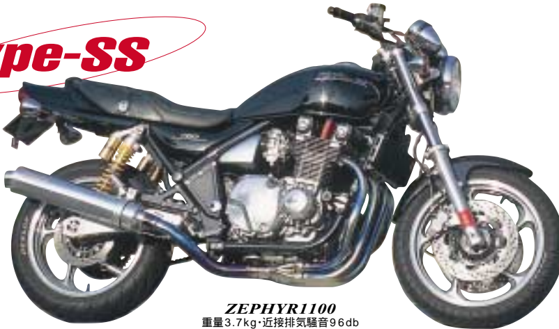
ZEPHYR1100 重量 3.7kg・近接排気騒音 96db