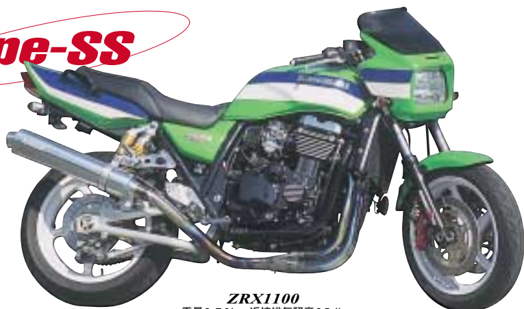
ZRX1100 重量3.70kg・近接排気騒音95db