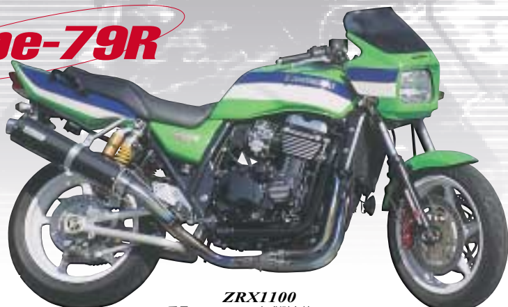
ZRX1100 重量3.53kg・FIM方式測定値102db (法定方式測定値98db)