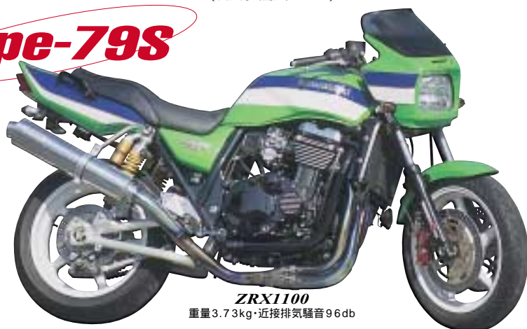
ZRX1100 重量3.73kg・近接排気騒音96db